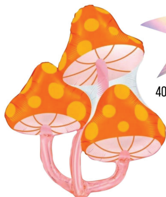
40" MUSHROOM SHAPE