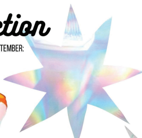
40" IRIDESCENT STARBURST