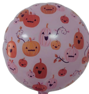
18" HALLOWEEN PRINT