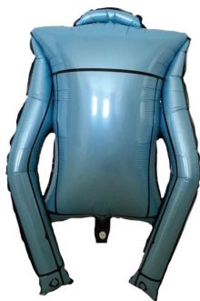
22" JEAN JACKET